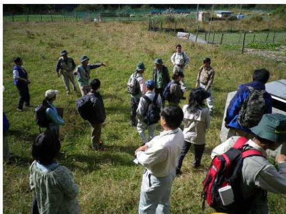
図 21 野外観察会風景。