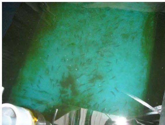
図13 実験飼育中のシナイモツゴ仔魚.