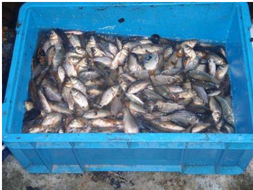
図16 池干しによって採集されたフナ類.