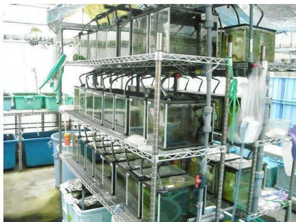
図12 繁殖補助手法の習得のために用いた温室、に設置された飼育水槽.