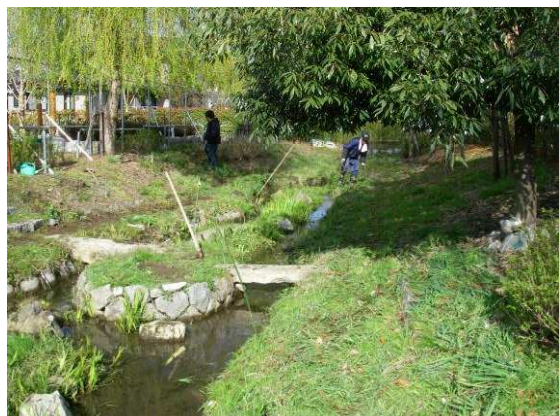
図 4 ホタル生息地の保全活動の風景。