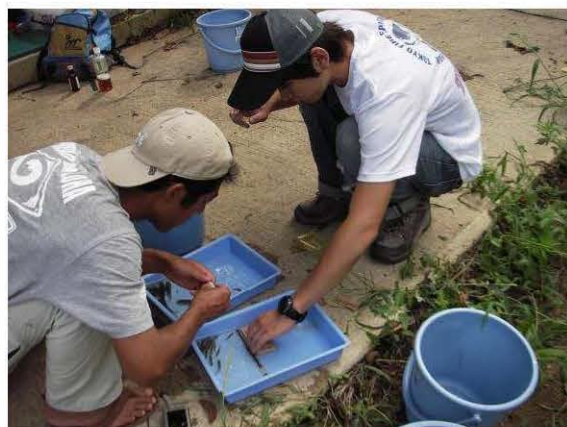
図11 モツゴの形態測定風景.