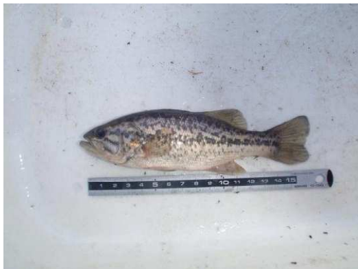
図17 初めて侵入が確認されたブラックバス.