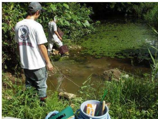
図9 モツゴの採集風景.