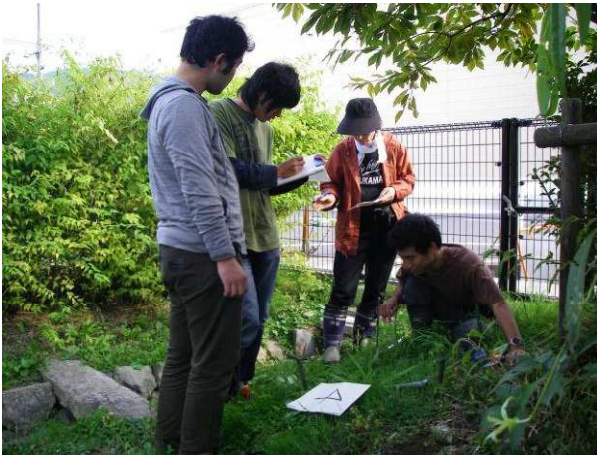
図 5 水路周辺の植生調査風景.