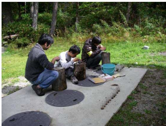
図2 ピットフォールトラップ調査におけるトラップ内の昆虫類の回収風景。