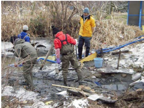
図15シナイモツゴとモツゴおよび他魚種の採集.