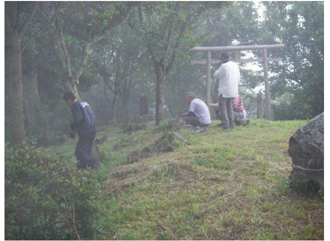
図 7 ヒメボタルの生息地でのホタル等の観察風景 (2010 年 7 月).

実際、学生の一部からは、大変楽しかった、有益だったとの感想が寄せられた。又、参加したいとの希望が寄せられている。