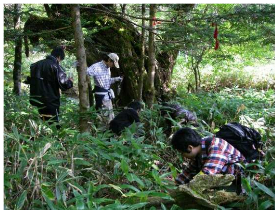
図1 山中における地表性昆虫相調査風景。

を見学するとともに、保全の基本的調査法を学ぶことである。ピットフォールトラップ調査とライトトラップ調査が実施された。調査実習では、採集された昆虫を同定し、種多様度を求めた。以下の図1-2に実習状況を示す。