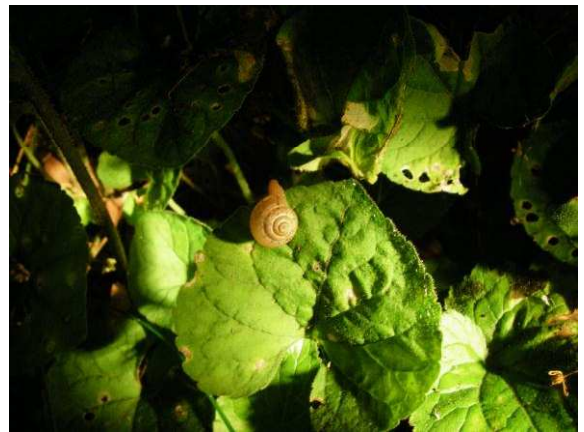
図 8 ヒメボタル生息地で見つかった陸生マキガイ.