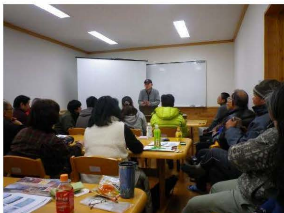
図 23 生物多様性勉強会の風景。