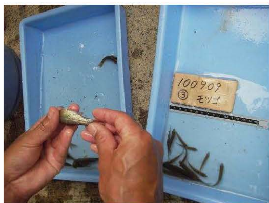
図10 採集された魚の種の同定.