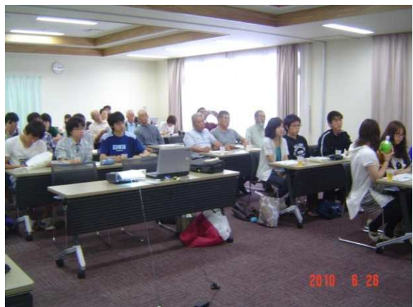
図 3 ホタルの保全学習会風景。

★これは生物多様性の保全と関連して、特に「ホタルもする良い自然環境を維持しよう」と、ホタルだけでなく生物多様性を重視する意味の「も」が入っている点に注目されたい。