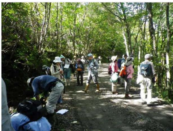
図 22 植物見学会の風景。