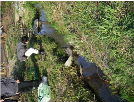
図 6 保全ホタル水路での水生昆虫相の調査.

次に、7 月に冠着山においてホタル調査を行ったので、それについて若干説明する。冠着山には、ヒメボタルが生息する。このホタルは陸生のホタルでマキガイを餌にしている。この山には多くのホタルが生息しているが、これはここが十分に自然が保たれていることによるのだろう。こうした場所を見学し、その実態を見たことは学生にも大変意義があったのではと思う。