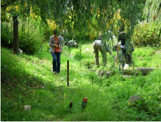
図 5 水路での地表性動物の調査風景.