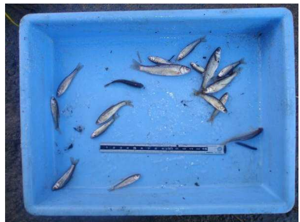
図19 採集されたタモロコ.