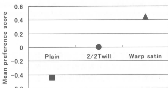
図 1 形容語「光沢がある黒」の平均嗜好度

この結果より、入射角 60°、受光角 20°、40°、60° で測定した光沢値と主観的な“光沢がある黒”との間には高い相関が見られた。