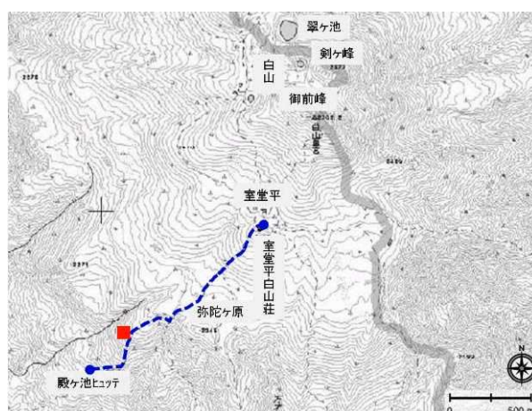
図2 白山のトランセクトルートと定点調査地点