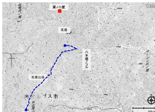
図1 北岳のトランセクトルートと定点調査地点

定点調査地として蝶ヶ岳近くの標高2664mの三角点（定点1）と蝶ヶ岳ヒュッテから約500m南の標高約2520mにあるお花畑（定点2）を設定した（図