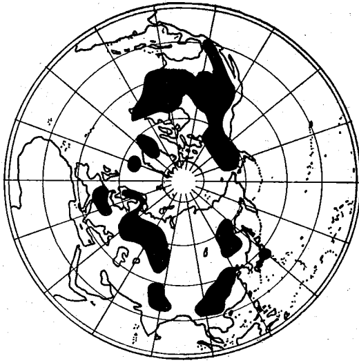
Fig. 3. Distribution of the genus Gentianopsis

12. GENTIANA corollis quinquefidis infundibuliformibus terminalibus sessilibus, foliis margine membranaceis. Gentiana foliis margine membranaceis basi coadunatis. Amoen. acad. 2. p. 343. Gentiana humilis aquatica verna. Amm. ruth. 4: t. 1. Habitat in Sibiria. D. Amman. ☉