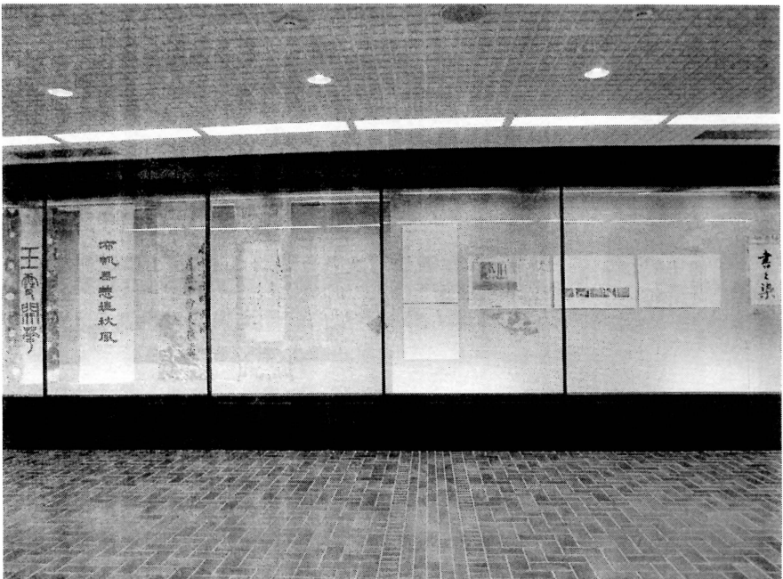
写真1 卒業書道展での展示発表（於 信濃教育博物館1F展示室へ続くロビー）