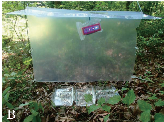
図2. 糞虫採集に用いたトラップ (A: ベイトトラップ, B: 衝突板トラップ Flight Intercept Trap)