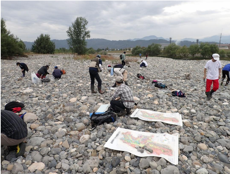
図2 長野県総合教育センターの講座の様子（松本市 梓川の河原，2019年10月）