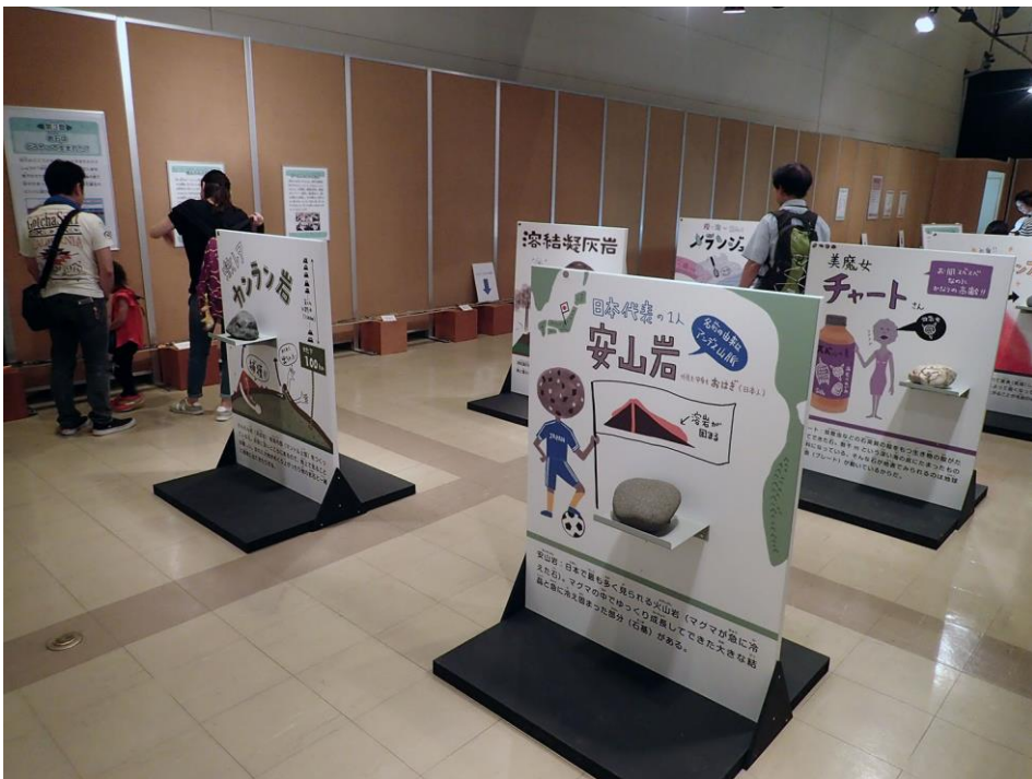
図3 長野市立博物館の企画展示の様子（2019年7月）