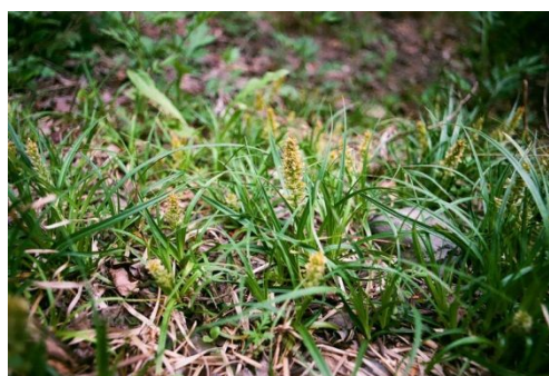
写真 1. 自生地におけるヒメスゲ（左）とアブラシバ（右）

次に、では、これら 2 種の種子採集はほぼ予定通り実施することができ、2 年間保存までの条件を揃えることができた。しかし、の発芽試験については、計画期間中に新型コロナ禍による学生の入構制限による実験補助（アルバイト雇用）の枯渇などにより、本格的な発芽実験の実施には至らなかった。ただし予備実験において、これら 2 種の発芽特性（光要求性など）を大まかに把握することができ、条件が整いしだい本実験を行うことのできる基礎を整えることはできた。