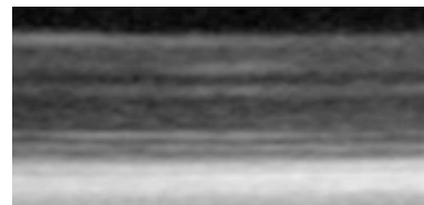
図 swept source optical coherence tomography(SS-OCT)画像 マウス網膜の層構造が明瞭に描出された。

図は、正常マウスにおいて撮影できた swept source OCT 画像である。図のように、網膜の内顆粒層、外顆粒層、外境界膜、inner segment/ outer segment junction line など総てが観察できる。従って、網膜浮腫による視細胞の障害の評価も可能となった。