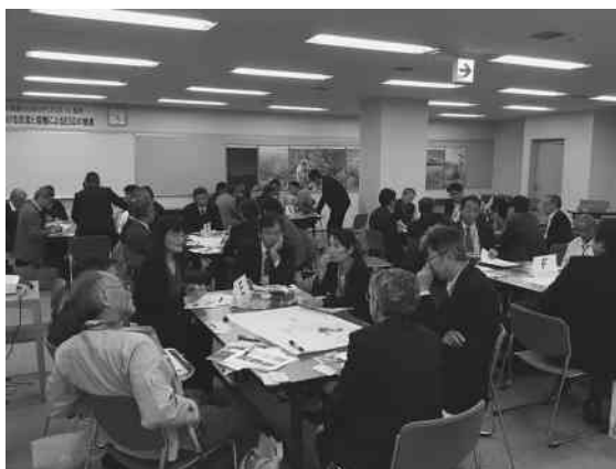
写真4 「ESD 推進のためのダイアログ in 信州：ユネスコエコパークにおける交流と協働による ESD の推進」 (2018年10月13日, 志賀高原総合会館98)