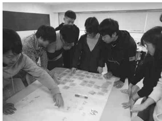
写真2 自然教育実習（環境教育概論：経法学部）