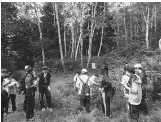
写真1 自然教育実習（環境教育：教育学部）