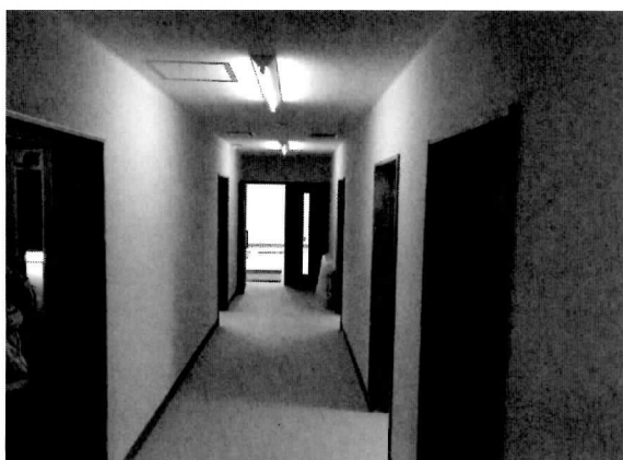
耐震改修後の2F廊下