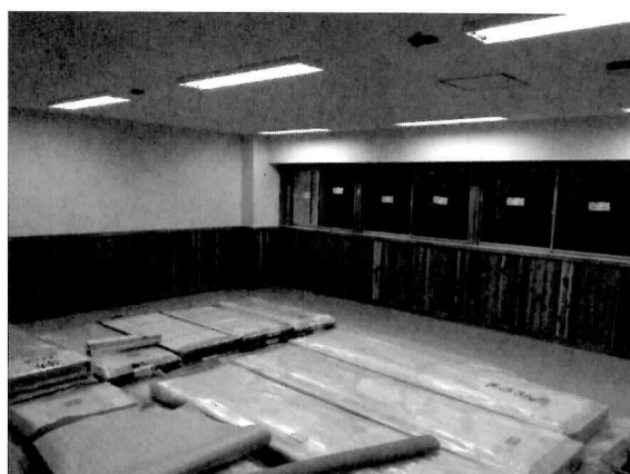
耐震改修後のラウンジ