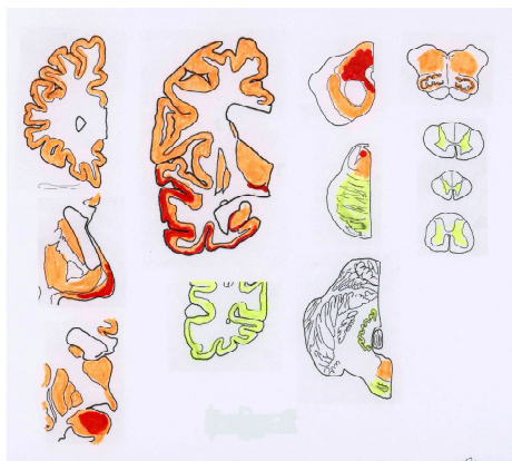
図 2. G-PDC のステージ IV の p-タウ。赤が高密度、黄緑が低密度、橙は中程度。学会発表(1)

PDC と G-ALS の脳脊髄における p-タウは大脳皮質と基底核から発して大脳を拡大進展し、最終的に脳幹に達することを明らかにした。この p-タウの進展ステージは 5 段階(0~IV)に分けられ、アルツハイマー病の p-タウの進展様式とは全く異なっていることを見出した(図 2)。