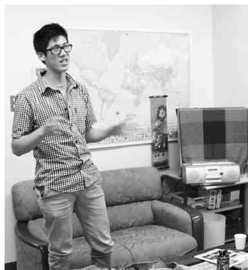
図3 TCCの1コマ TCCにて、Albertaについてプレゼン中のカナダ人研修生。

学生が主体的に参加し、母語や文化が異なる学生間のコミュニケーションが活性化されれば、国内にいても「外向き」の場は創生できる。可能なら母国を離れ、異文化環境で実体験を得ることが望まれるが、それも文科省が後押ししてくれている。自主研究演習の海外派遣が現行の教育課程の中に位置付けられたように 注7) 、短期間で完結できる「臨床実習」受け入れ派遣は教育課程の中に比較的位置付けやすく、実現可能な国際化推進活動と考える。受け入れ身分、単位規定、更には課題として残されている宿泊先の確保等、学部としての受け入れ体制がより一層、具体的に、着実に、進められることを期待するものである。