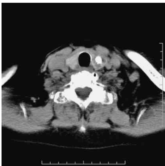
図1 症例3，頸部CT検査 腫瘍内部に粗大石灰化を認めた。